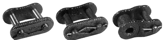
スプリングクリップ (Type Sp CL)