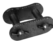
"S" ピン (Type S)