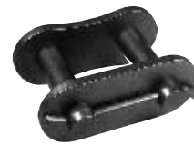
通し"S" ピン (Type TS)