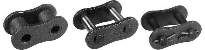
ローラリンク (Type R/L)